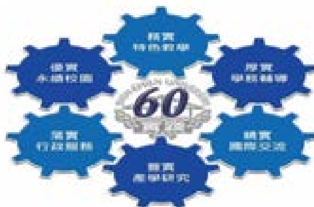
4-1 「實踐 60」架構圖